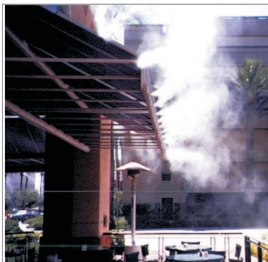
CLIMATIZAÇÃO EM RESTAURANTE